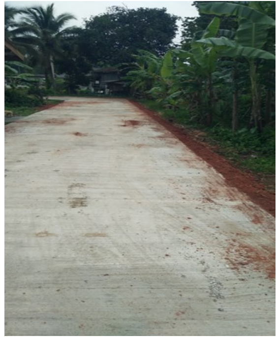
โครงการก่อสร้างถนนแบบพาราแอสฟัลท์ติกคอนกรีต สายโรงเรียนพัฒนาอิสลาม หมู่ที่ ๑